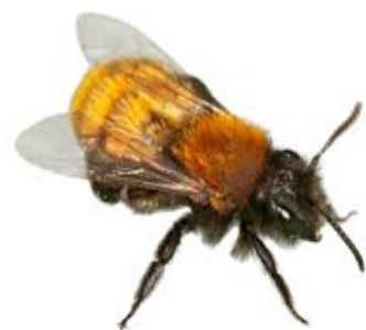
Ausstellung Wildbienen in Vitrinen des Naturmuseums Solothurn