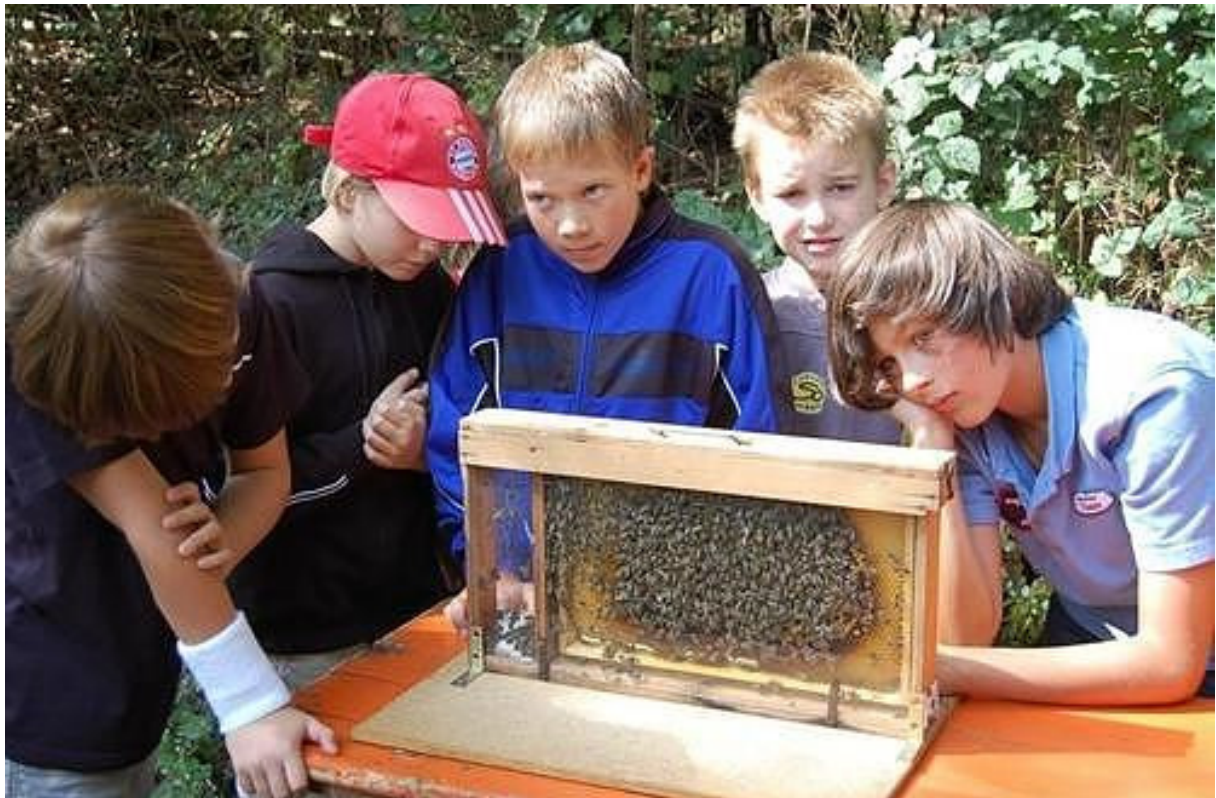
Lebendes Bienenvolk in Schauwabe, Bienenmodelle und anderes vom Wallierhof